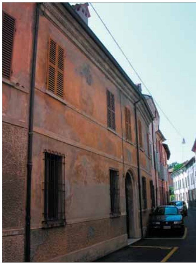
Via Garzoni 9 Fronte Principale